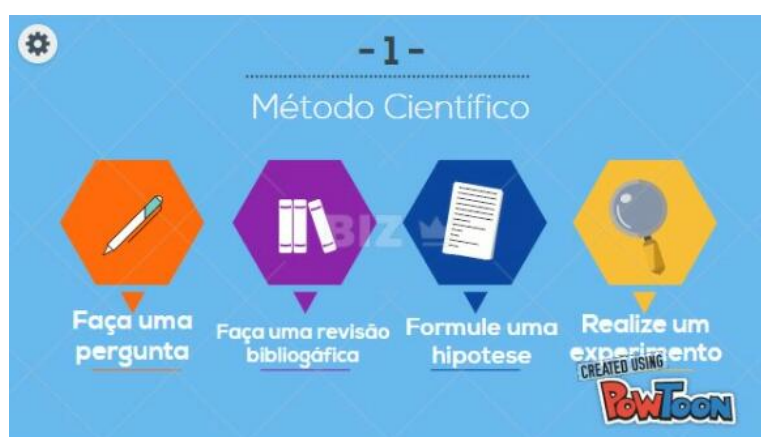
Figura 2 - Modelo do material do aplicativo (vídeos). Para cada tópico foi desenvolvido vídeo didático.